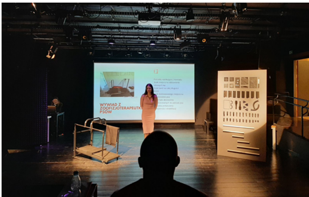
Захист диплому студентки спеціальності дизайн продукту