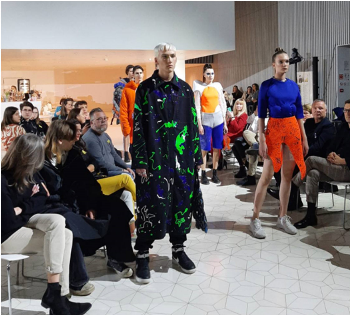
Показ колекцій моделей одягу

Особливістю проекту Fash'n'Acte не тільки його благодійна спрямованість, але суспільно-політична направленість. Так, остання колекція шоу була дуже зворушливою формою протесту проти проблемних ситуацій у світі, в тому числі і війни в Україні.