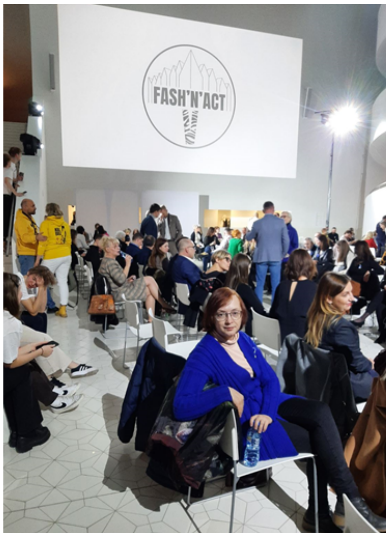
В очікуванні показу мод у філармонії ім. Мечислава Карловича