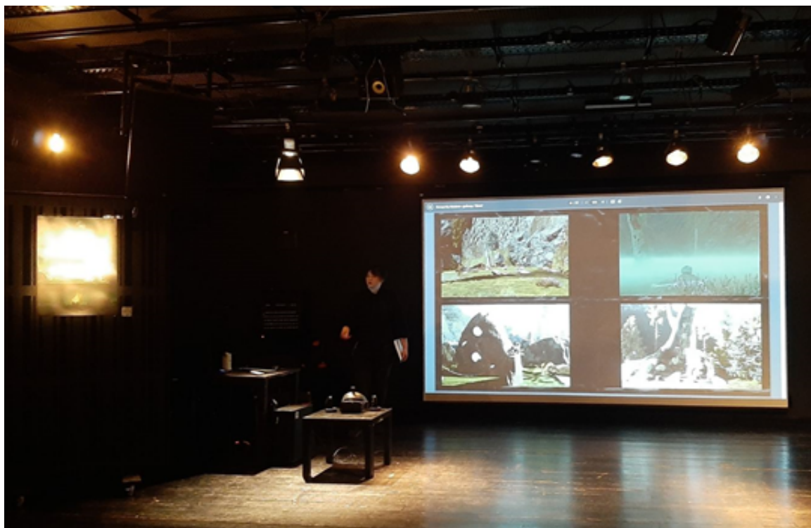
Захист диплому студентки спеціальності комп'ютерні ігри та віртуальна реальність