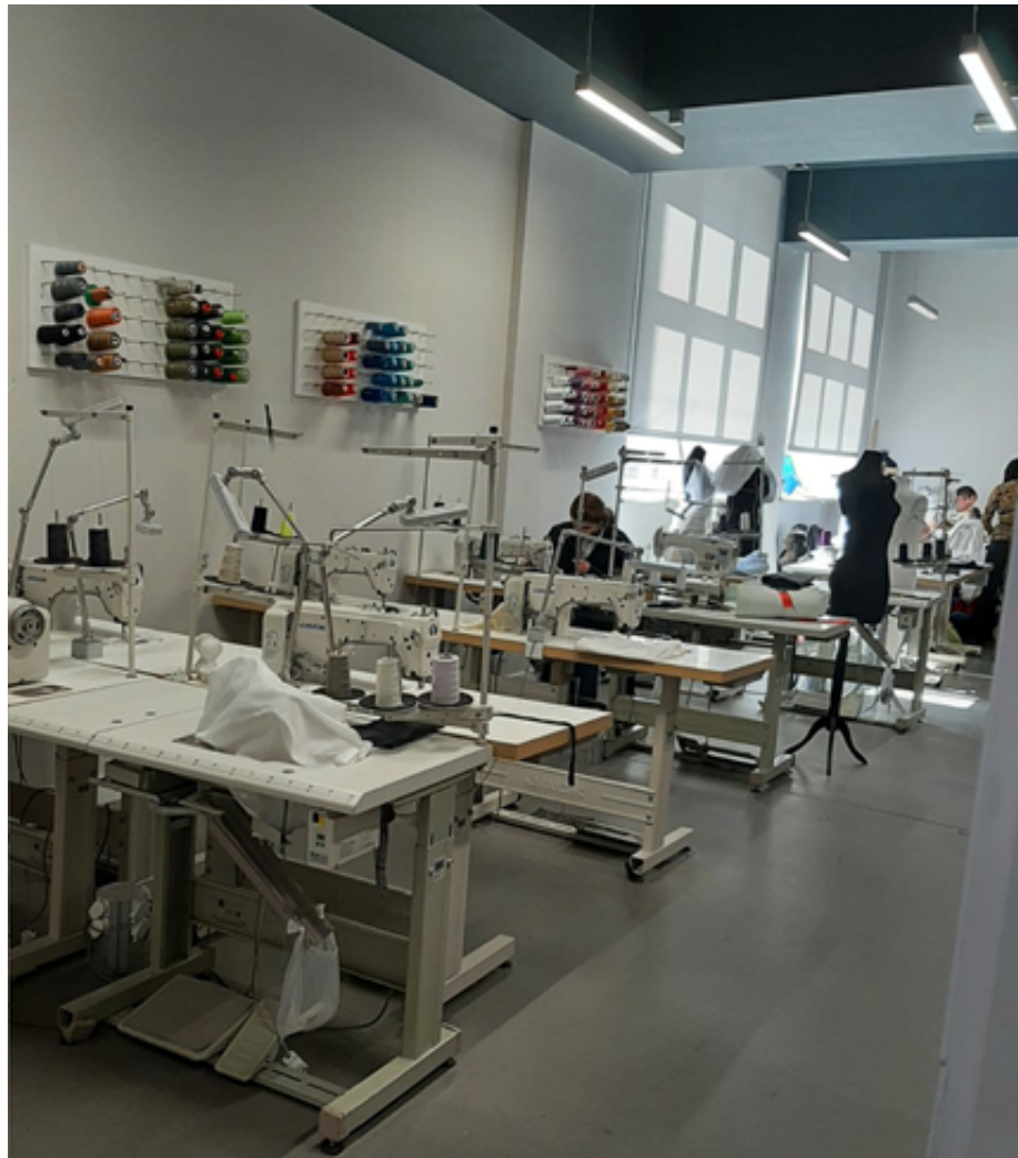
Лабораторія виготовлення одягу факультету дизайну

Цього року кошти збирали для дітей із синдромом Дауна та для постраждалих від війни в Україні.