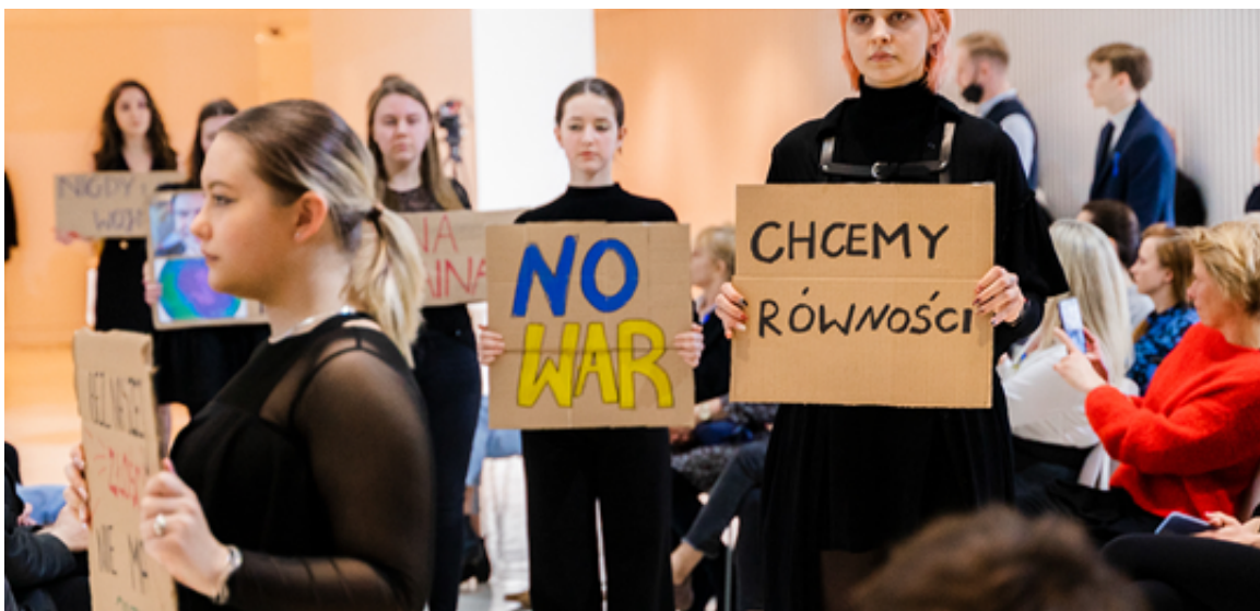
«Hi!» війні в Україні

Особливістю проекту Fash'n'Acte не тільки його благодійна спрямованість, але суспільно-політична направленість. Так, остання колекція шоу була дуже зворушливою формою протесту проти проблемних ситуацій у світі, в тому числі і війни в Україні.